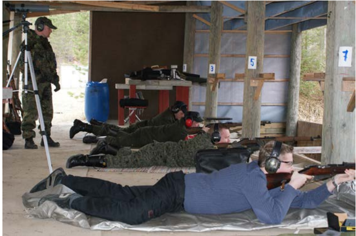
Viime vuoden ampumataitopäivä järjestettiin mm. Juankoskella.

Tapahtumapaikan turvallisuusjärjestelyistä johtuen paikalle pääsevät vain määräpäivään mennessä ilmoittautuneet henkilöt. Ilmoittautumisen yhteydessä voit varata myös omakustanteisen lounaan.