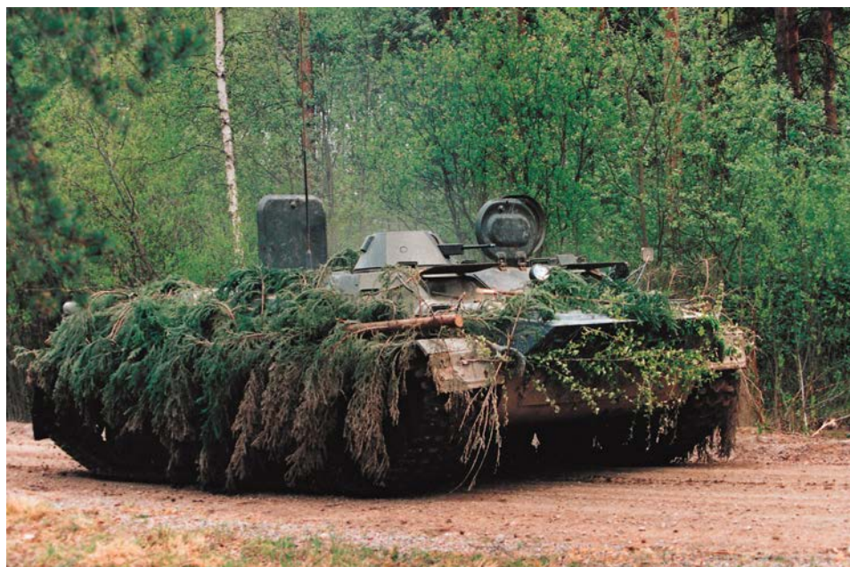
Puolustusvoimat on tilannut 147 MTLB-ajoneuvoa Ruotsista.