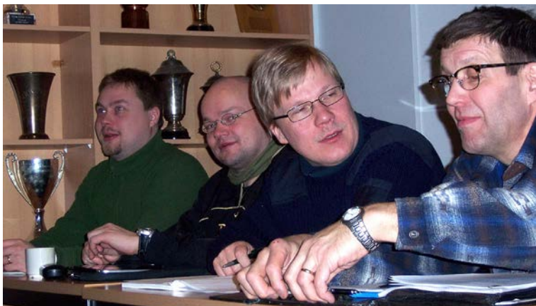
Oulun ampumakorttikouluttajakoulutuksen ryhmätyöt käynnissä.

kisteriin tehdä asianmukainen muutosilmoitus tietojen saattamiseksi ajan tasalle. Lisätietoja sääntömuutosten ja nimenkirjoittajien ilmoittamisesta rekisteriin löytyy tämän tiedotteen sivulta 10.