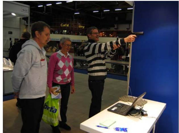
Helsingin GoExpo-messuilla oli mahdollisuus harjoitella ekoaseamuntaa.

Onnea voittajille ja kiitos esittelijöille!