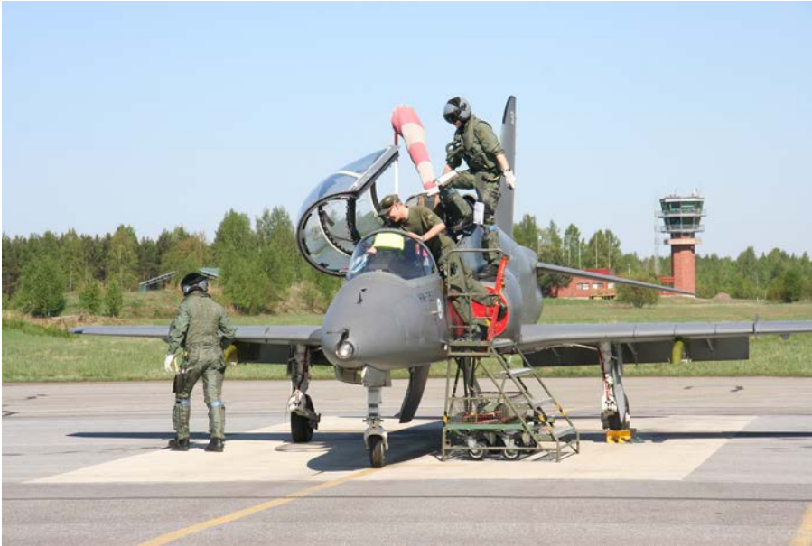
Koulutuspäivä järjestetään 14.-15. Lentosotakoululla Kauhavalla. Osallistujat pääsevät tutustumaan Hawk-harjoitushävittäjiin.