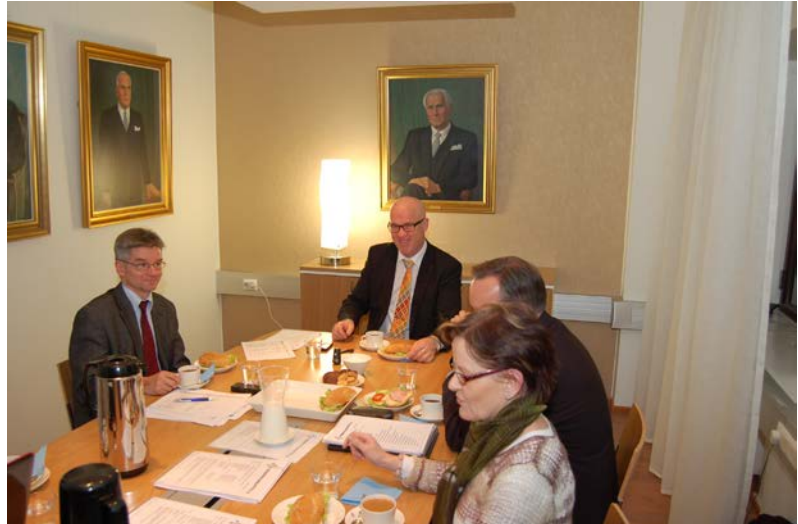
Reserviläisliiton uuden kokoustilan ensimmäinen käyttäjä oli liiton puheenjohtajisto, joka piti siellä kokouksensa 20.1.

Uusien toimitilojen remontointi ja varustaminen oli liitolle suurehko kertainvestointi mutta ei juuri vaikuta liiton vuosittaisiin kuluihin.