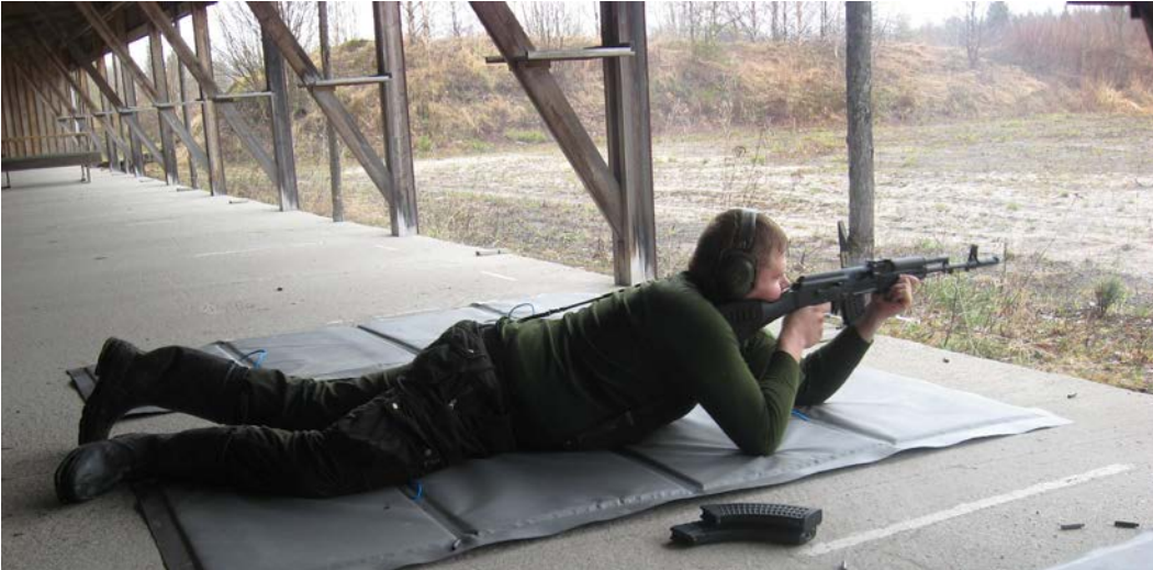
Jokaisen reserviläisen tulisi harjoitella ammuntaa säännöllisesti.