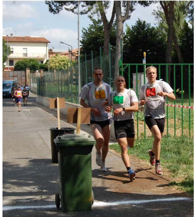
Liiton joukkue voitti AESOR-järjestön sotilasmoniottelun vuonna 2009 Italiassa.