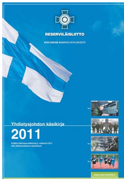
Yhdistysjohdon käsikirjan ulkonäkö on uusittu.

Uusi yhdistysjohdon käsikirja ilmestyy näillä näkymin helmikuun puolenvälin tienoilla.