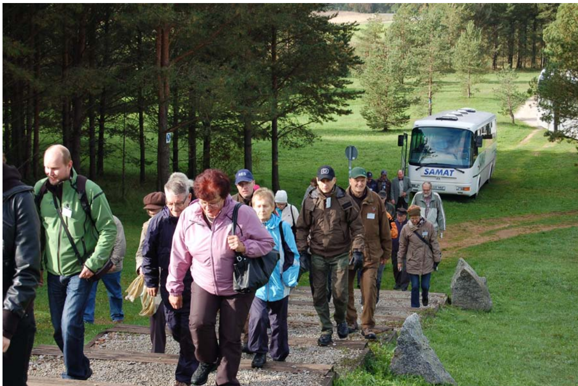
Liiton huipputapahtumaan on hyvä kutsua uusia jäseniä. Kuva liiton huipputapahtumasta, joka järjestettiin viime vuonna Virossa..

litrojen määrä ylittää sovitun rajan. Liitot ohjaavat saamansa provision edelleen jäsenyhdistystensä toiminnan tukemiseen. Jäsenkorttia kannattaa siis tankatessa käyttää.