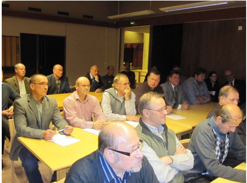
Kainuun piiri-info järjestettiin Kainuun Prikaatin tiloissa 21.10.

Osaston esittelijöinä toimivat aseisiin ja ampumaharrastukseen perehtyneet reserviläiset. Mukana on niin nuoria kuin vähän kokeneempiakin maanpuolustajia.