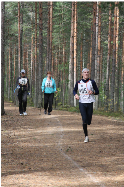
Vuonna 2011 reserviläiset liikkuvat aiempaa enemmän.

Myös yhdistykset voivat hyödyntää jäsenistön aktivoimisessa sähköistä kuntokorttia vertailemalla jäsenistön liikunta- ja ammuntauurituksia, julkaisemalla väliaikatietoja esim. yhdistyksen nettisivuilla sekä palkitsemalla parhaita järjestelmästä saatavien suoritetietojen avulla. Jokaisen yhdistysten puheenjohtajalla ja sihteerillä on oikeus ottaa kuntokorttijärjestelmästä tarvittavia raportteja.