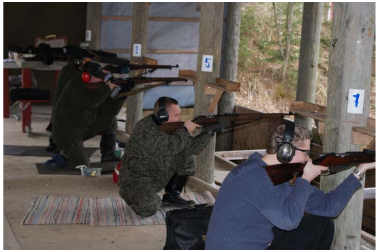
Reserviläisiä ampumassa Juankoskella.

Tilaisuuksiin osallistujilta vaaditaan ammuntauurheilu- ja tuntemusta sekä kokemusta kouluttamisesta. Tilaisuuden perusteella on mahdollista myöntää sekä ampumakortti että oikeus AMPU-kurs-