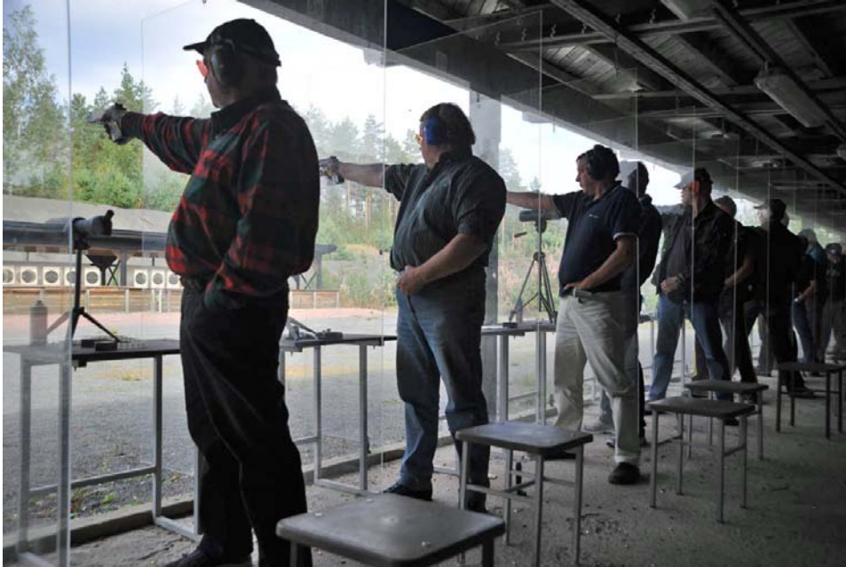
Uusi aselaki tuo tullessaan mm. kahden vuoden pakollisen harjoittelujakson ennen ensimmäisen käsiase-luvan myöntämistä. Kuva liiton viime vuoden ampumamestaruuskilpailista.