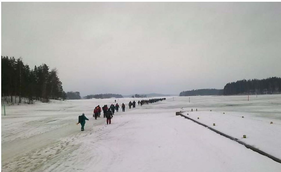
Viime vuoden pilkkikilpailu järjestettiin Taipalsaarella.

Prosenttiammunnan tulos lasketaan 1.1. - 31.12.2011 välisenä aikana järjestetyistä edellisessä kohdassa mainittujen liittojen, piirien tai kerhojen valvotuista kilpailuista, ampumaharjoituksesta, koulutus- ja koetilaisuuksista. Kultakin osallistuneelta yhdistyksen jäseneltä merkitään yksi (1) ampumasuoritus / vuosi. Kilpailun säännöt löytyvät netistä ResUL:n sivuilta osoitteessa http://www.resul.fi/index.phtml?s=52 .