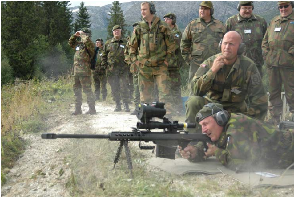
Suomalaisia reserviläisiä Norjan kodinturvajouk- kojen vieraana.