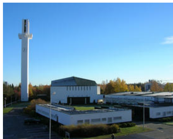
Seinäjoen maamerkinä tunnetaan Lakeuden Risti, joka sijaitsee Hotelli Lakeuden läheisyydessä.

Myös lauantain lounaan voi varata ennakkoon liiton nettisivujen kautta. Lounas tarjoillaan Hotelli Lakeudessa klo 13-15 ja se maksetaan paikan päällä. Keittolounaan hinta on 11 euroa ja lounas noutopöydästä 17 euroa. Lounas noutopöydästä järjestetään, mikäli ruokailijoita on vähintään 30 henkilöä.