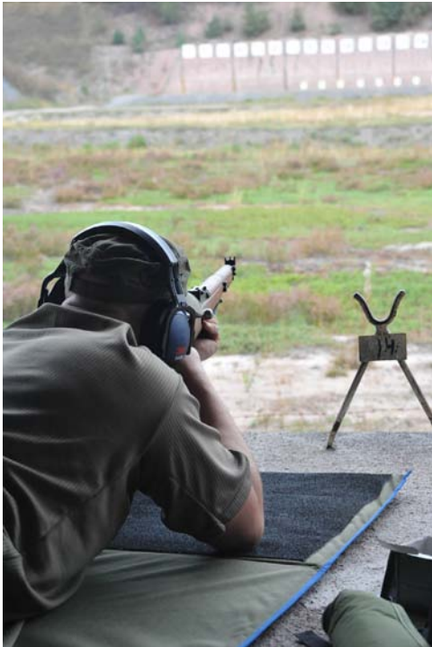
Reserviläisliiton ampumamestaruuskisat järjestettiin elokuussa Porin Prikaatin ampumaradalla.