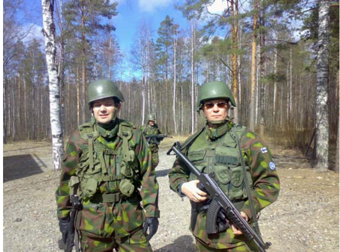
Aliupseeriksi voi taas opiskella reservissä.

Koulutukseen voi hakea koko maan alueelta. Hakemus liitteineen tulee toimittaa hakijan oman sotilasläänin aluetoimistoon, jotta se huomioitaisiin vuoden oppilasvalinnoissa. Haku on jatkuva. Hakemus tulee tehdä hakulomakkeella, joka löytyy mm. liiton nettisivuilta. Päätöksen tekee sotilasläänin esikunta, joka tiedottaa päätöksestään marraskuun aikana.