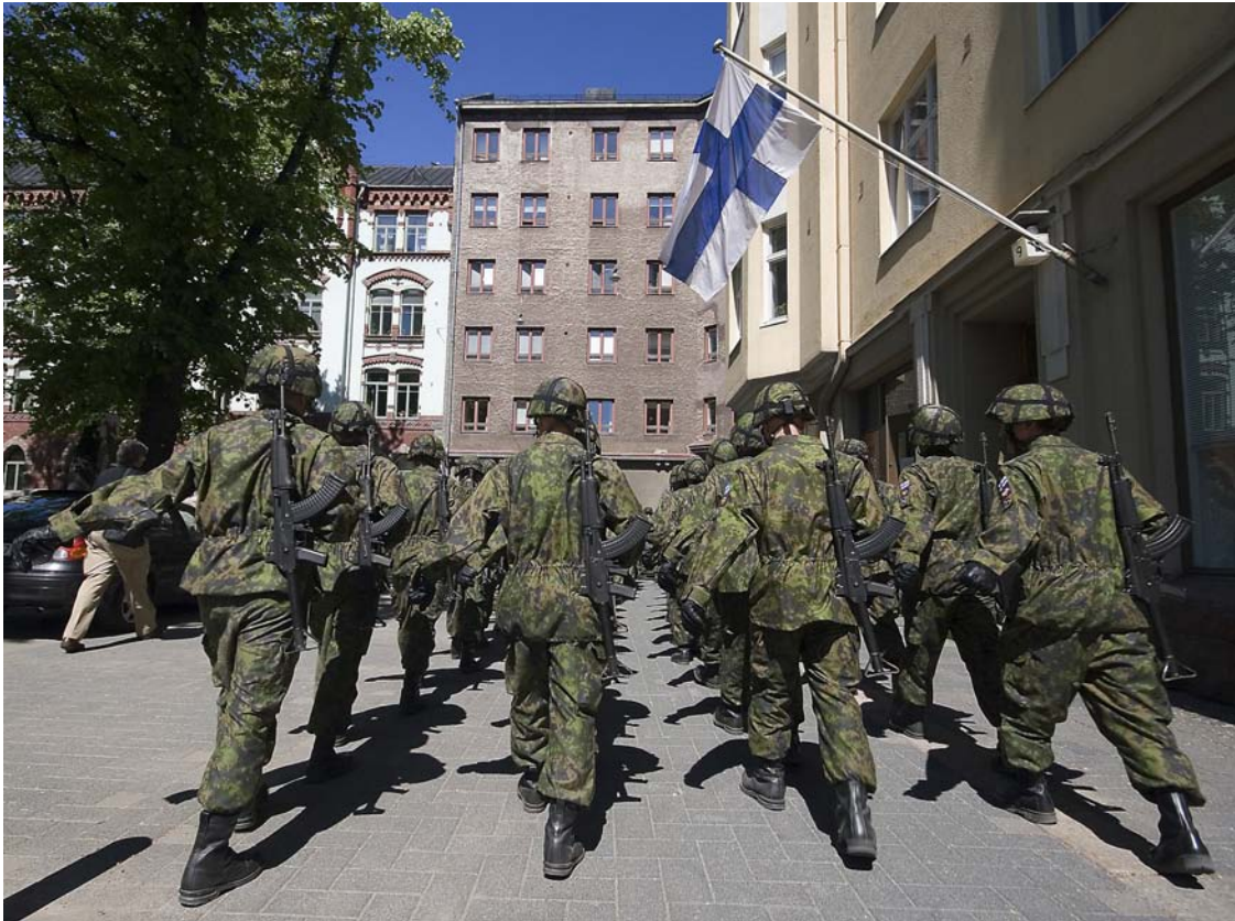
Vihreät haluaa luopua yleisestä asevelvollisuudesta. Reserviläisliitto taas katsoo, että tehokas puolustus voidaan rakentaa vain nykymuotoisen asevelvollisuuden varaan.