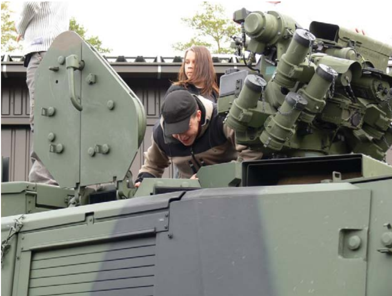
Jurvan Reserviläiset järjestivät tutustumiskäynnin syyskuussa 2008 Porin Prikaatiin. Mukana oli myös reserviläistoiminnasta kiinnostuneita perheenjäseniä.