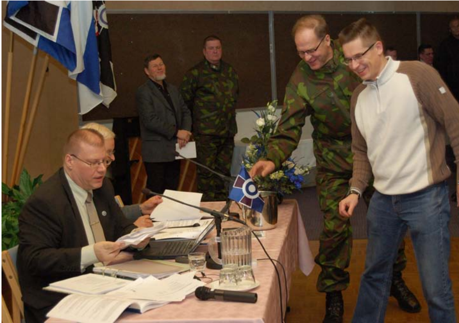
Reserviläisliito järjestää vuodessa kaksi liittokokoustapahtumaa, jonka järjestelyissä nojaututaan vahvasti paikalliseen yhdistykseen tai piiriin. Kuva Jyväskylän syyskokouksesta vuodelta 2007.

Virallinen syyskokouskutsu julkaistaan seuraavassa yhdistystiedotteessa sekä lokakuun Reserviläinen-lehdessä. Lisätietoja kokoustapahtumasta löytyy liittojen kotisivuilta. Kokousviikonlopun tarkempi ohjelma on liitteenä ja löytyy myös liiton www-sivuilta.