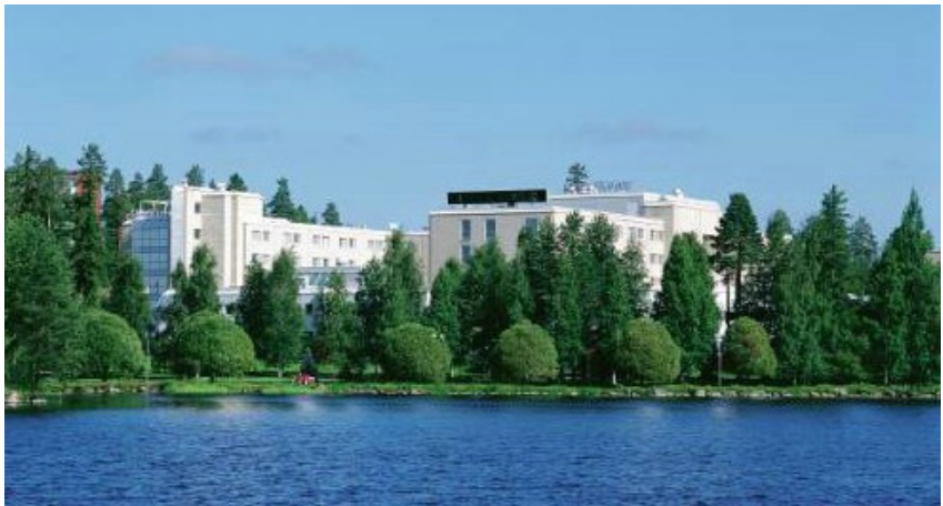
Hotelli Kajanus on Kajaanin korkeatasoisin hotelli.

Reserviläisliiton hallituksessa aiemmin toimineille henkilöille tarkoitetun RES-klubin kokous pidetään Kajanuksen tiloissa 17.4 alkaen kello 12.00. RES-klubin kokouk-