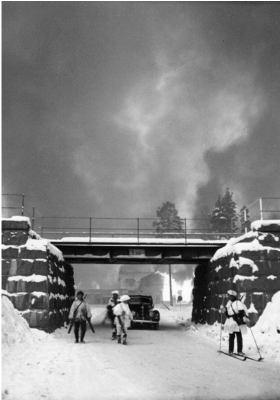
Yksi postikortti kuvaa suomalaisia joukkoja vetäytymässä palavasta Suvilahden kylästä.