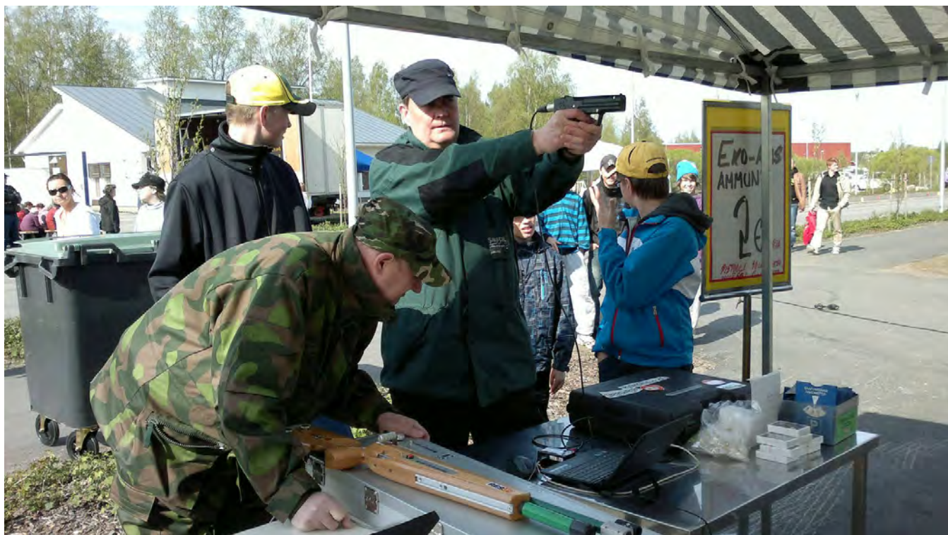
Vihannin reserviläiset olivat mukana Vihannin messuilla.