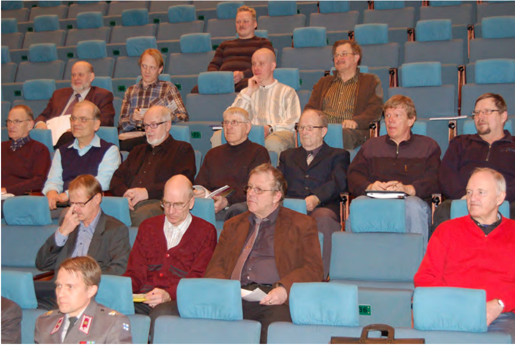
Suur-Savon piiri-infossa oli paikalla noin 50 paikallisten reserviläisyhdistysten ja reserviupseerikerhojen edustajaa.

jäsenhankintakampanjan järjestämisestä ensi vuonna. Käytännössä jälkimmäinen tarkoittaa valitun piirin osalta Reserviläisliitosta ja -toiminnasta kertovan tiedotuslehden jakamista jokaiseen kotitalouteen sekä siihen liittyvää jäsenhankintakampanjaa, jossa piirin jäsenyhdistykset esittelevät toimintaansa omilla kotipaikkakunnillaan.