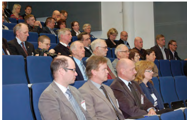
Tampereen poliisiammattikorkeakoululla järjestetty vuosikokous keräsi paikalle noin 150 osallistujaa.