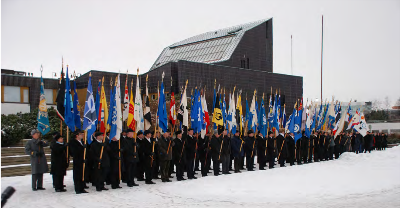
Seinäjoen yhteisen liittokokouksen lippumarssiin osallistui satakunta yhdistysten ja kerhojen lippuja kantajineen.