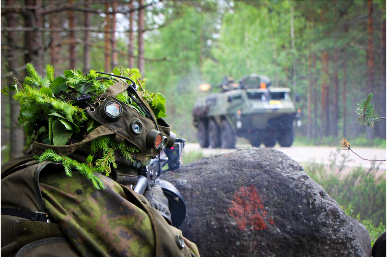
Keltainen yrittää murtoa vaunuilla, kuva Pyörremyrsky-harjoituksesta.