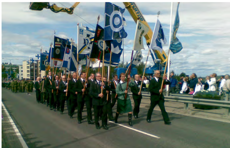
Reserviläisliiton lippu oli mukana valtakunnallisessa paraatissa 4.6. Rovaniemellä.